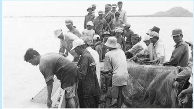
សហគមន៍ជាច្រើនមានការអាក់អន់ចិត្តខ្លាំងឡើងៗដោយសារជម្លោះ ដ៏ខ្លាំងក្លានិងកង្វះដំណោះស្រាយលើបញ្ហានេសាទ។ ជាញឹកញាប់, សហគមន៍មួយចំនួនបានសម្រេចដោះស្រាយបញ្ហាដោយផ្ទាល់ដៃ ខ្លួនឯង។ ឧទាហរណ៍ការរឹបអូសឧបករណ៍នេសាទខុសច្បាប់ដូចដែល បានបង្ហាញតាមរយៈរូបភាពខាងលើដែលកើតឡើងក្នុងខេត្តតាកែវ។

នៅមុនពេលដែលអង្គការមិនមែនរដ្ឋាភិបាលចាប់ ផ្តើមធ្វើការសិក្សាទៅលើបញ្ហាជលផល សហគមន៍នេសាទ ដែលទទួលបានការប៉ះពាល់ធ្ងន់ធ្ងរបានប្រើប្រាស់វិធីសាស្ត្រ របស់គេរួចទៅហើយនៅក្នុងការដាក់ការគាបសង្កត់ទៅលើ រដ្ឋាភិបាល។ ខុទ្ទកាល័យរបស់នាយករដ្ឋមន្ត្រី គឺជាគោលដៅ នៃលិខិតដែលប្រកបដោយការខឹងសម្បាររបស់សហគមន៍ ការធ្វើបាតុកម្មនៅមុខរដ្ឋសភាជាតិ និងការគាបសង្កត់ពី អន្តរការីនៅក្នុងខុទ្ទកាល័យនាយករដ្ឋមន្ត្រី។ ទោះបីជាវិធី ធ្វើការតស៊ូមតិបែបនេះពិតជាចេញមកពីបំណងពិតប្រាកដ នៅក្នុងការគាបសង្កត់ទៅលើរដ្ឋាភិបាលក្តី តែគេពិបាកនឹង វាស់វែងបានពីប្រសិទ្ធភាពរបស់វាណាស់។ អ្នកខ្លះមានការ សង្ស័យថា បច្ចេកទេសទាំងនេះមានប្រយោជន៍ណាស់នៅ