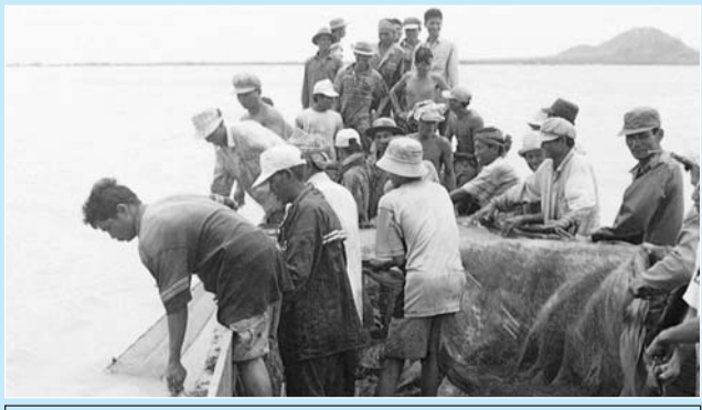
សហគមន៍ជាច្រើនមានការអាក់អន់ចិត្តខ្លាំងឡើងៗដោយសារជម្លោះ ដ៏ខ្លាំងក្លានិងកង្វះដំណោះស្រាយលើបញ្ហានេសាទ។ ជាញឹកញាប់, សហគមន៍មួយចំនួនបានសម្រេចដោះស្រាយបញ្ហាដោយផ្ទាល់ដៃ ខ្លួនឯង។ ឧទាហរណ៍ការរឹបអូសឧបករណ៍នេសាទខុសច្បាប់ដូចដែល បានបង្ហាញតាមរយៈរូបភាពខាងលើដែលកើតឡើងក្នុងខេត្តតាកែវ។

នៅមុនពេលដែលអង្គការមិនមែនរដ្ឋាភិបាលចាប់ ផ្តើមធ្វើការសិក្សាទៅលើបញ្ហាជលផល សហគមន៍នេសាទ ដែលទទួលបាននូវការប៉ះពាល់ធ្ងន់ធ្ងរបានប្រើប្រាស់វិធីសាស្ត្រ របស់គេរួចទៅហើយនៅក្នុងការដាក់ការគាបសង្កត់ទៅលើ រដ្ឋាភិបាល។ ខុទ្ទកាល័យរបស់នាយករដ្ឋមន្ត្រី គឺជាគោលដៅ នៃលិខិតដែលប្រកបដោយការខឹងសម្បាររបស់សហគមន៍ ការធ្វើបាតុកម្មនៅមុខរដ្ឋសភាជាតិ និងការគាបសង្កត់ពី អន្តរការីនៅក្នុងខុទ្ទកាល័យនាយករដ្ឋមន្ត្រី។ ទោះបីជាវិធី ធ្វើការតស៊ូមតិបែបនេះពិតជាចេញមកពីបំណងពិតប្រាកដ នៅក្នុងការគាបសង្កត់ទៅលើរដ្ឋាភិបាលក្តី តែគេពិបាកនឹង វាស់វែងបានពីប្រសិទ្ធភាពរបស់វាណាស់។ អ្នកខ្លះមានការ សង្ស័យថា បច្ចេកទេសទាំងនេះមានប្រយោជន៍ណាស់នៅ