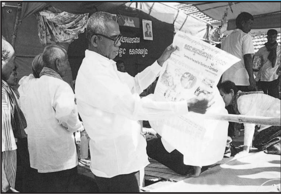
អង្គការត្រួតពិនិត្យការបោះឆ្នោតចែកចាយព័ត៌មានដល់តំបន់ជនបទ

សេចក្តីផ្តើមរបស់មេធាវី , ការសំណុំរឿងប្រឈមមុខ និង មេរៀន