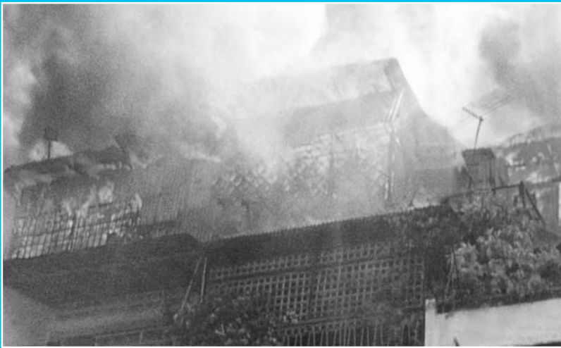
ខាងឆ្វេង : ការខូចខាតដោយអគ្គិភ័យនៅថ្ងៃទី ២៦ ខែ មីនា ឆ្នាំ ២០០២ នៅប្រាក់តាន់ប៉ា